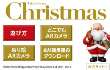
『タカシマヤ サンタ』TOP画面