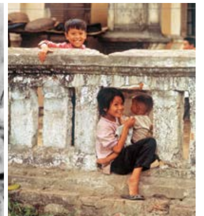
市街戦の痕跡が残るフエで(1968年4月)