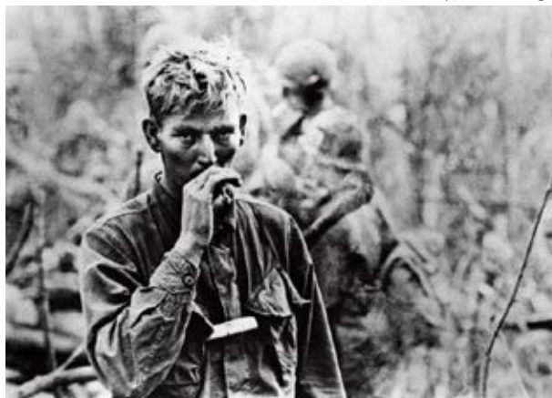
救助ヘリを待つ米兵(1967年12月)